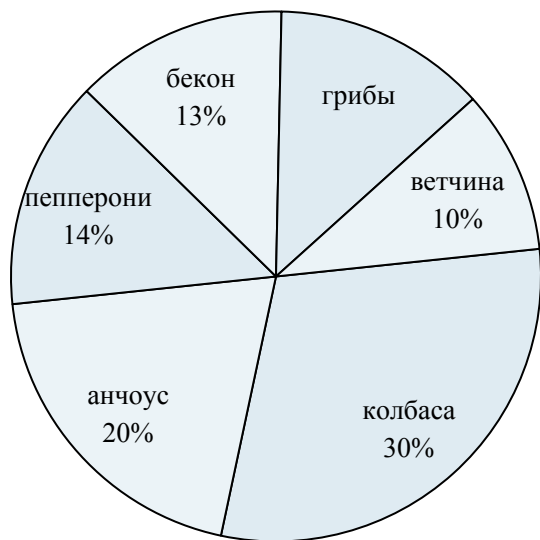
Рейтинг начинок пицц